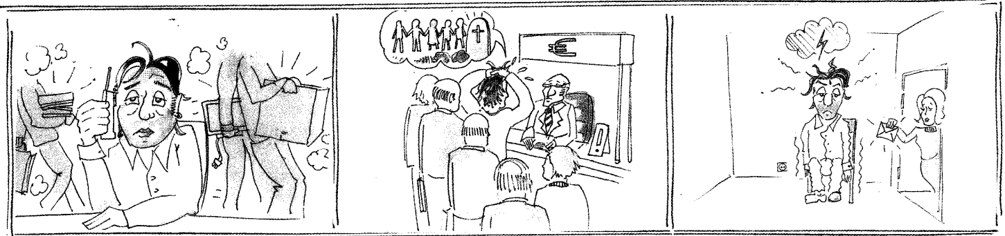
richter & kiehn

Der Durchsuchungsleiter hat die Pflicht, dem Handwerker seinen Dienstaussweis vorzuzeigen.